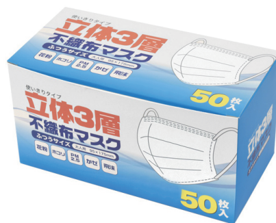
個別包装なしタイプ