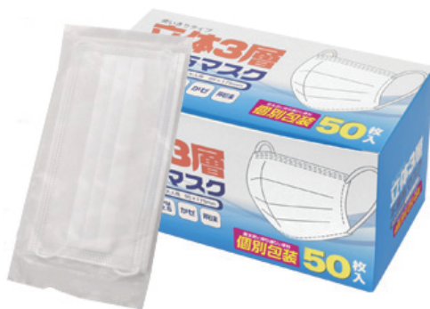
個別包装ありタイプ