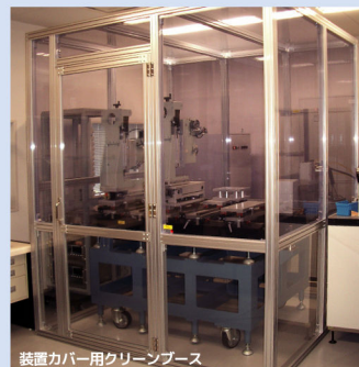
装置カバー用クリーンブース