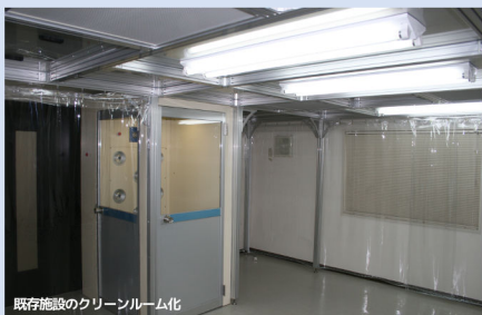
既存施設のクリーンルーム化