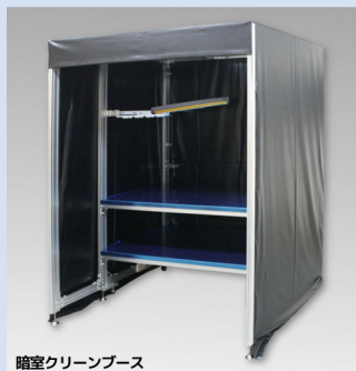
暗室クリーンブース