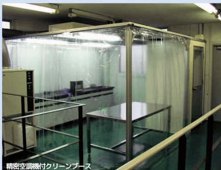
精密空調機付クリーンブース