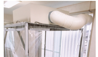
排気ダクトの設置も可能 (オプション)