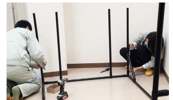
組立・解体・移設・保管が簡単